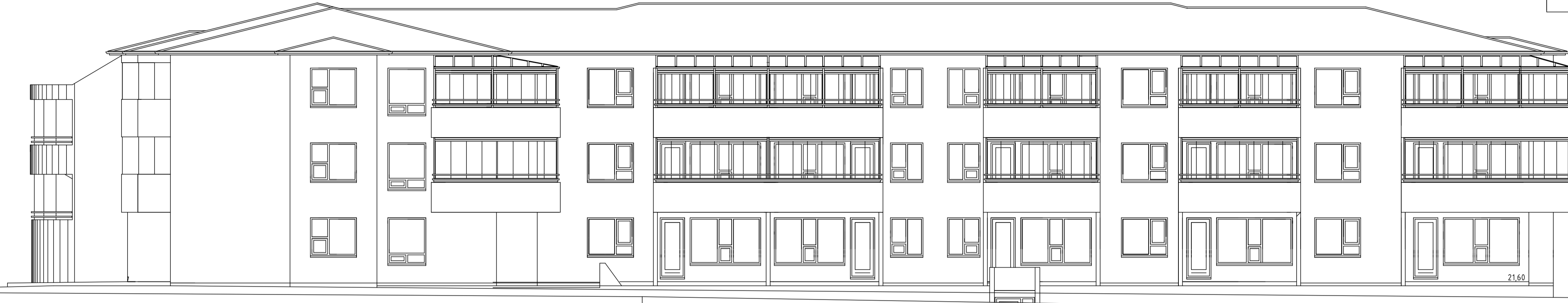
ÚTLIT VESTUR MKV. 1:100.