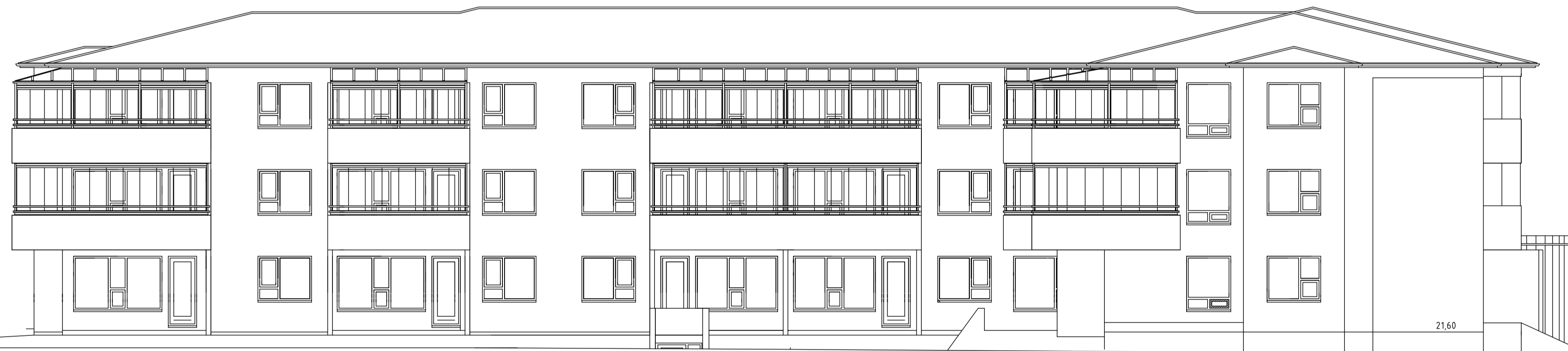
ÚTLIT SUÐUR MKV. 1:100.