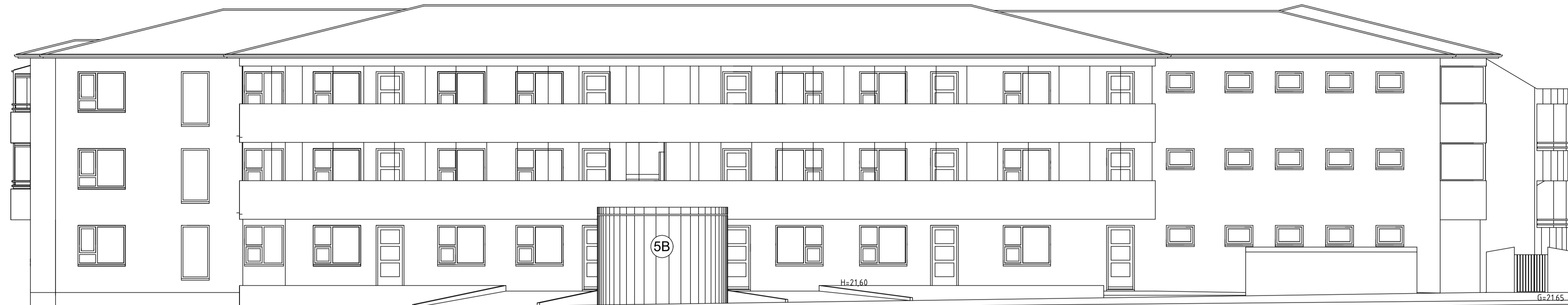
ÚTLIT AUSTUR MKV. 1:100.